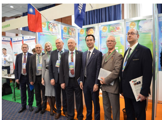
▲ 當地廠商蒞臨台灣展區洽談合作