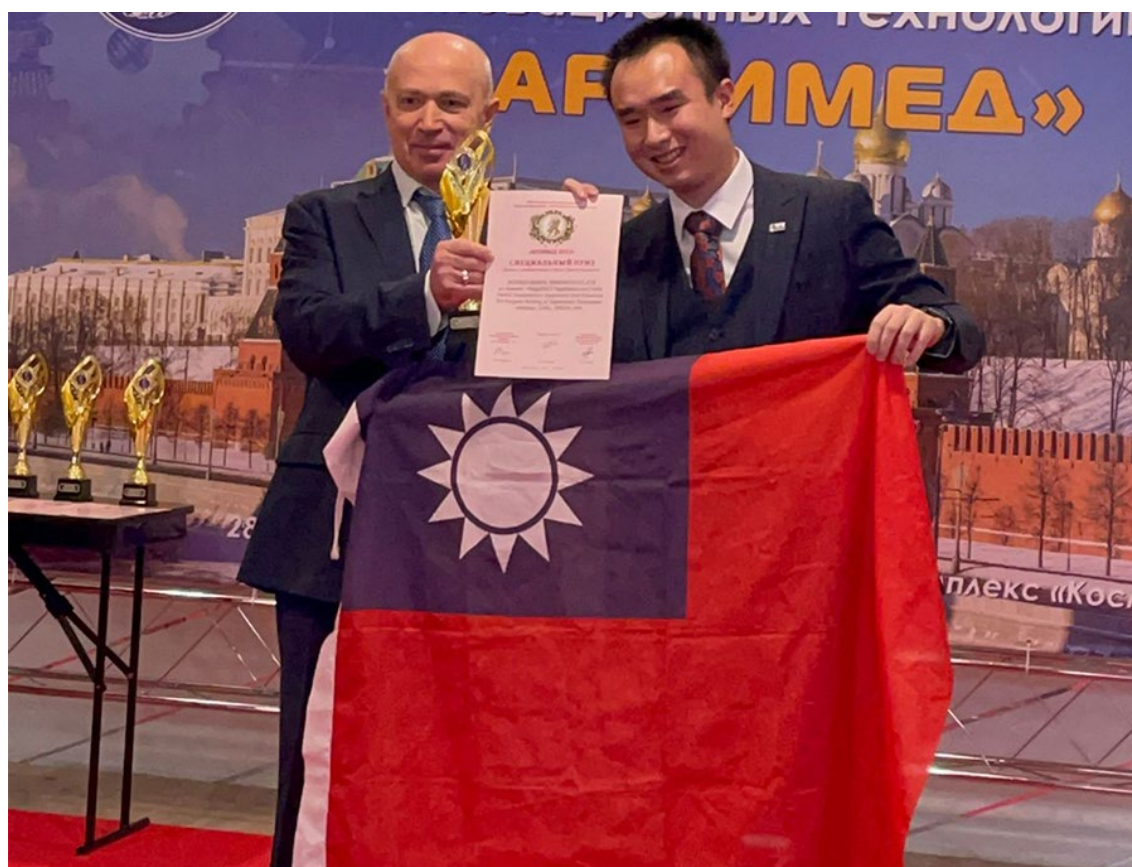
▲ 大會主席 Dmitry Zezyulin 頒發獎項給 TIPPA

格外珍貴的是，參展團隊成員橫跨教育研發單位、生醫界大廠等，作品類別包含生技、醫療、農業技術、生活用品等，創造力豐盛多元，是非常具潛力與實踐力的發明協會，相當期待TIPPA未來帶領更多作品再闖俄羅斯與世界發明平台！