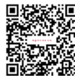
南臺科大招生考試報名系統