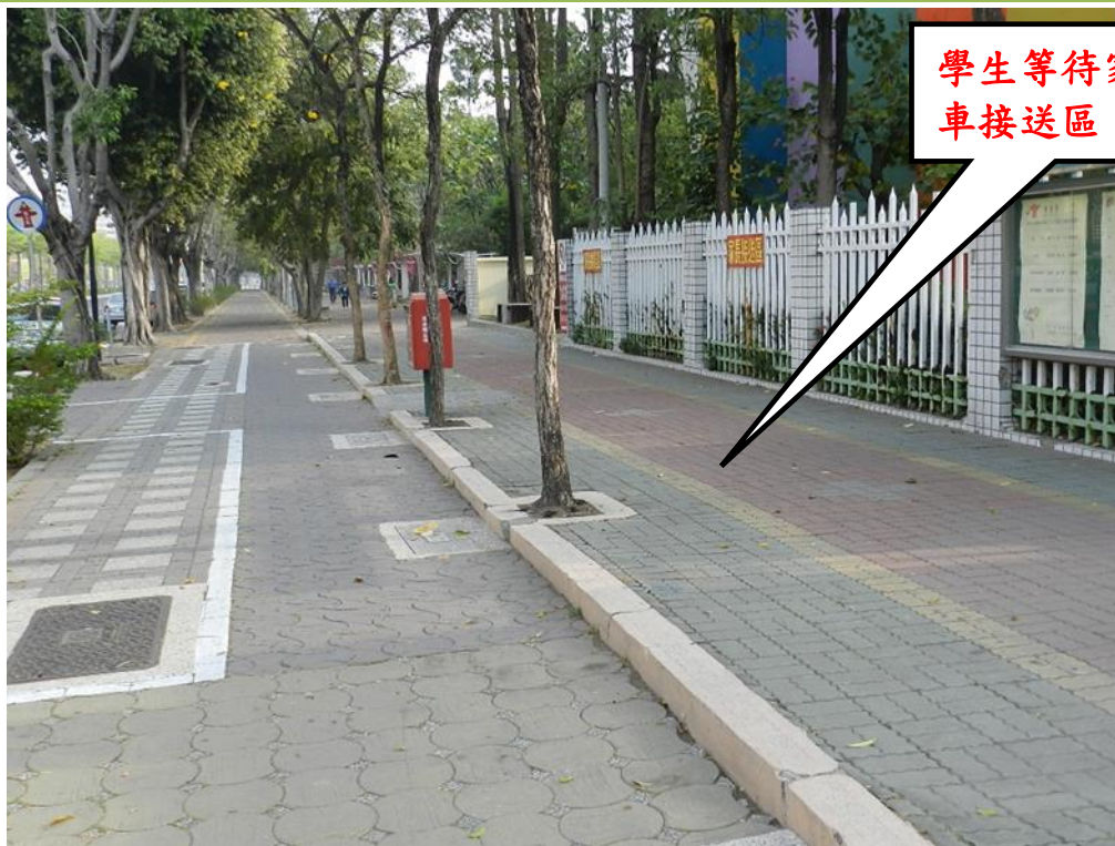
照片說明：林森路人行道(機車接送區)