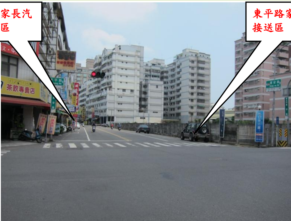
照片說明:東平、東安路(汽車接送區)