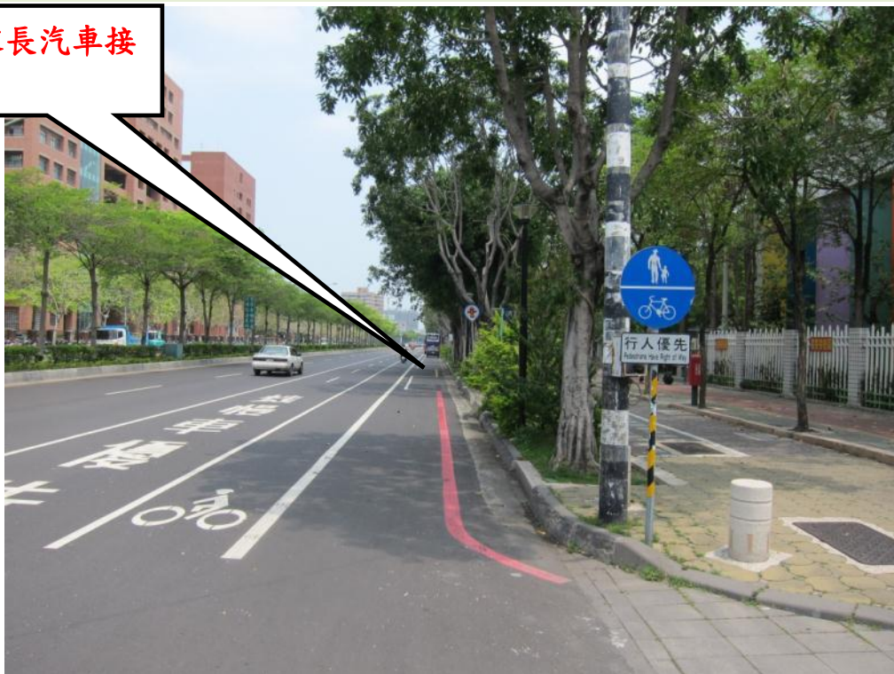
照片說明：林森路校門(汽車接送區)