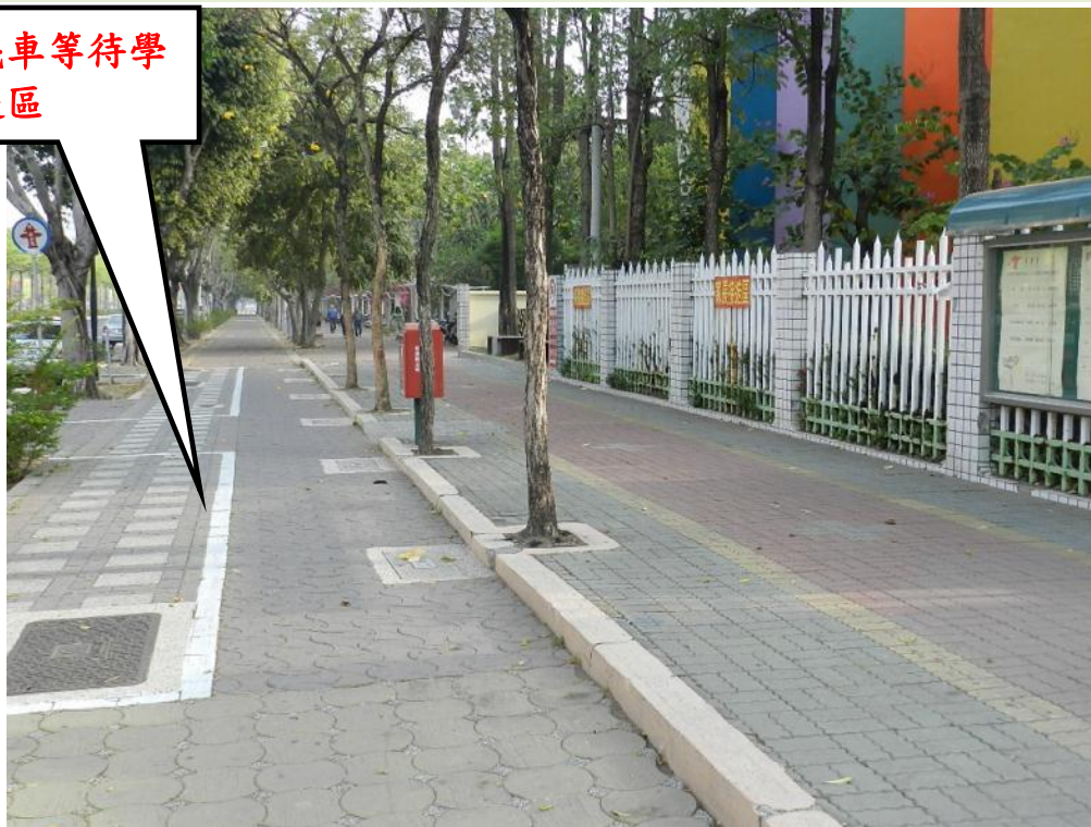
照片說明：林森路人行道(機車接送區)