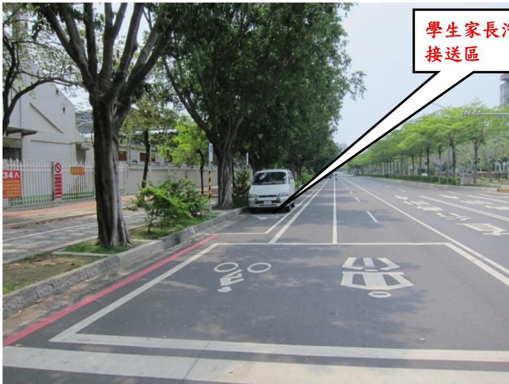
照片說明：林森路校門（汽車接送區）