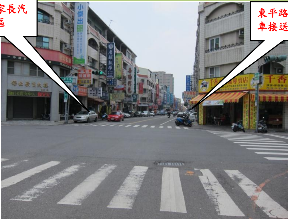
照片說明:東平、東安路(汽車接送區)